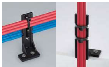
横配線、縦配線どちらでも固定できます。