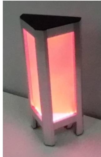
*表示例 乾燥注意 青 ほぼ安全 緑 注意・警戒 黄橙 危険 非常に危険 赤 赤点滅