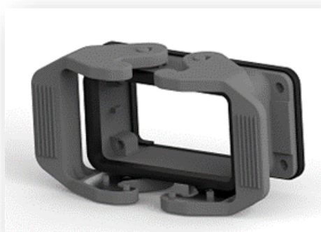
プラスチック ロッキングレバー付きハウジング H10B-AG-SL