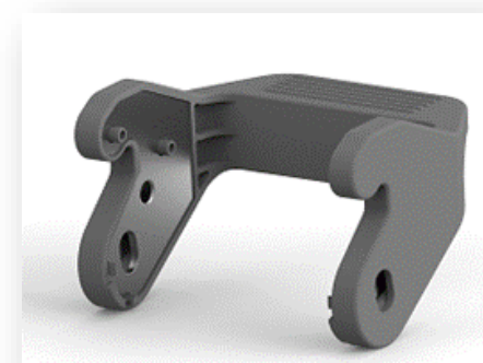
交換用プラスチックロッキングレバー HB Double Plastic Locking

* ロックレバー表面は樹脂製ですが、ロックレバー内部には金属パーツが組み込まれております。